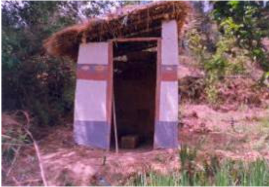
Cada casa debe tener su letrina...