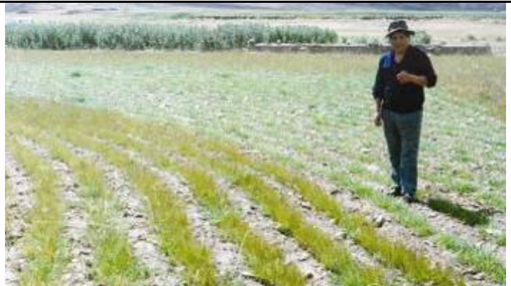
Plan de pastoreo para toda comunidad y siembra de pasto en terrenos en descanso para ganar el premio praderas de S/.2,000 para la comunidad que mejor cuide sus pastos