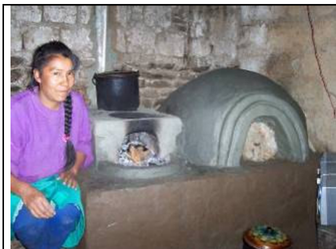
Cocina mejorada con horno en Lali