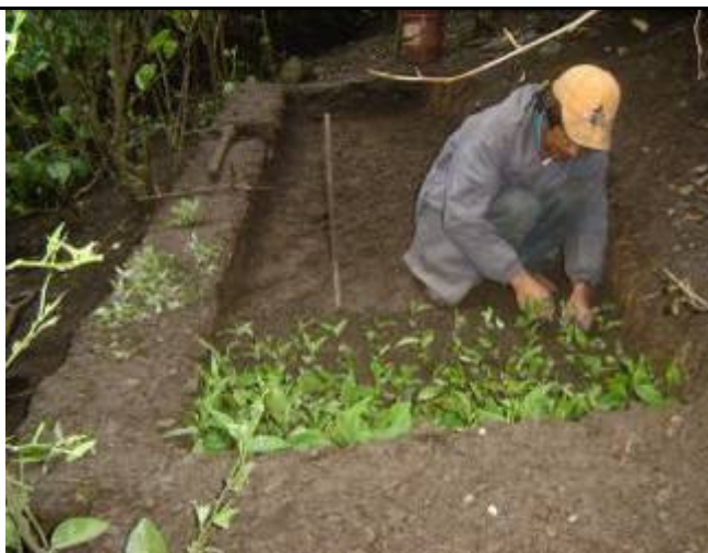
Vivero con miles de árboles en la Comunidad de Lali para ganar el premio forestal de S/2,000.