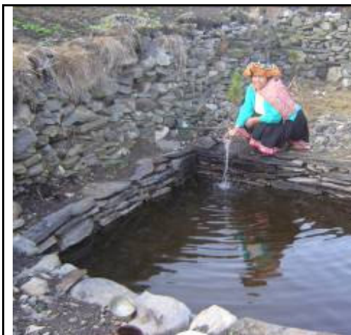
Piscigranja en Pachamachay