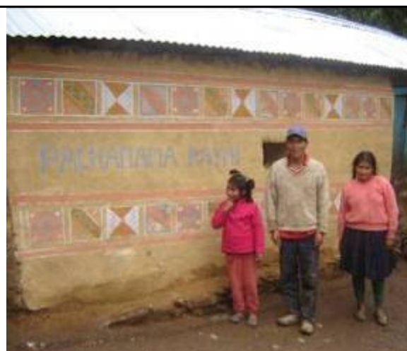
Mejoramiento de vivienda en Lali