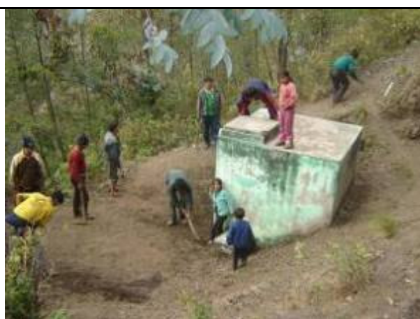
Limpieza de reservorios y doración del agua potable